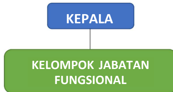
Gambar 1.1 Struktur Organisasi Loka POM di Kabupaten Bima

Berdasarkan Peraturan BPOM Nomor 22 Tahun 2020 tentang Organisasi dan Tata Kerja Unit Pelaksana Teknis di Lingkungan Badan Pengawas Obat dan Makanan, Struktur Organisasi Loka Pengawas Obat dan Makanan di Kabupaten Bima sebagai berikut: